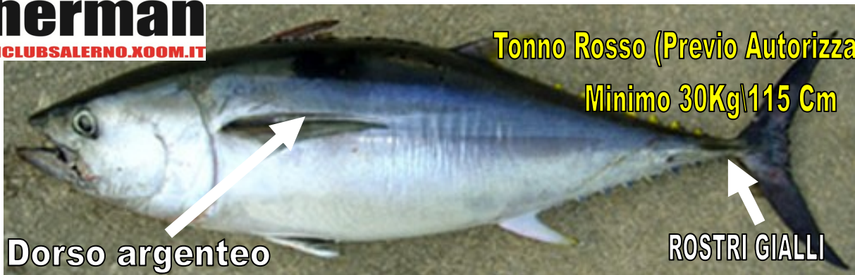
Tonno Rosso (Previo Autorizzazione)